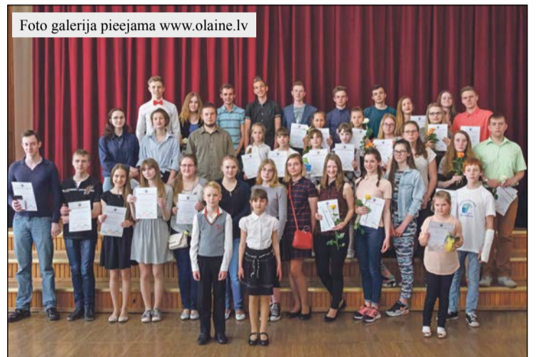
Foto galerija pieejama www.olaine.lv

Dienu vēlāk – 29. maijā – ir paredzēta ekskursija "Iepazīsim savu novadu". Vēlam jaukus un saulainus svētkus ikvienam novada iedzīvotājam, bet atgādinām par sabiedriskās kārtības ievērošanu, lai svētki noritētu bez starpgadījumiem!